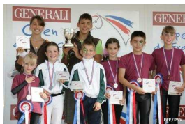
Le Cirque de Thiers